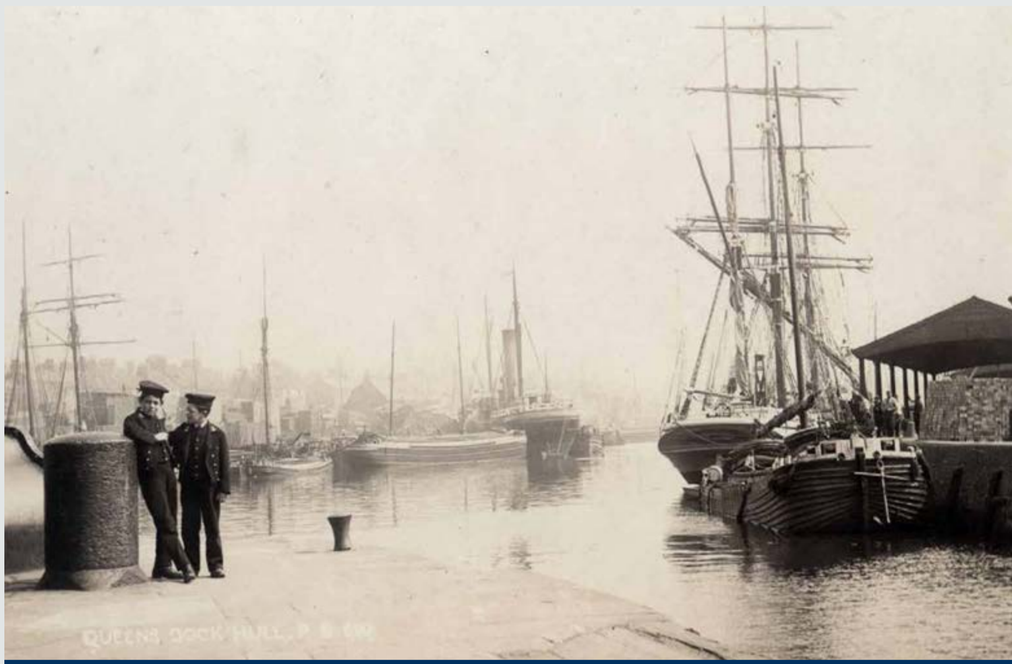
رصيف الملكات، 1904. تبين الصورة رصيف الملكات أثناء ازدهاره في أوائل القرن العشرين. يمكن رؤية المظلات ومناطق التحميل بجانب الجزء الجنوبي من الرصيف في المنطقة التي تقف عليها اليوم.

لقد شغلت السفن الشراعية أطراف الرصيف، متجهة إلى التجارة الدولية أو صيد الحيتان في مياه القطب الشمالي. كان يتم الدخول إلى الرصيف من خلال نهر هال وكان هذا المدخل يقود السفن إلى قلب هال مباشرة.