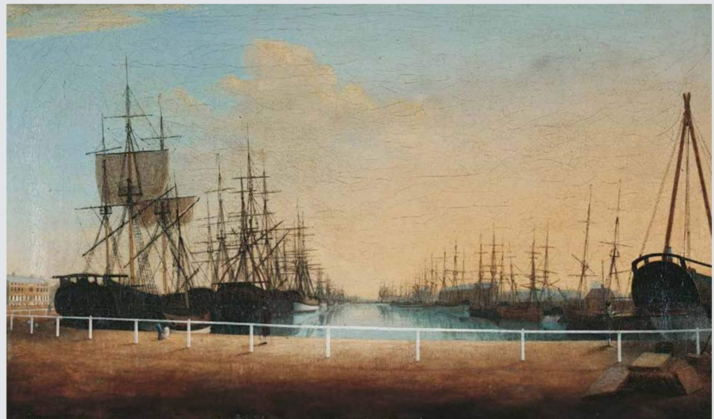
منظر غربي للرصيف الجديد لكينجستون أبون هال، رسمه روبرت ثيو، في نحو 1778-86. مجموعة معرض فيرينس للفنون (Ferens Art Gallery).

وأعيد تسميته في النهاية باسم رصيف الملكات بعد زيارة الملكة فيكتوريا لهال في عام 1854.