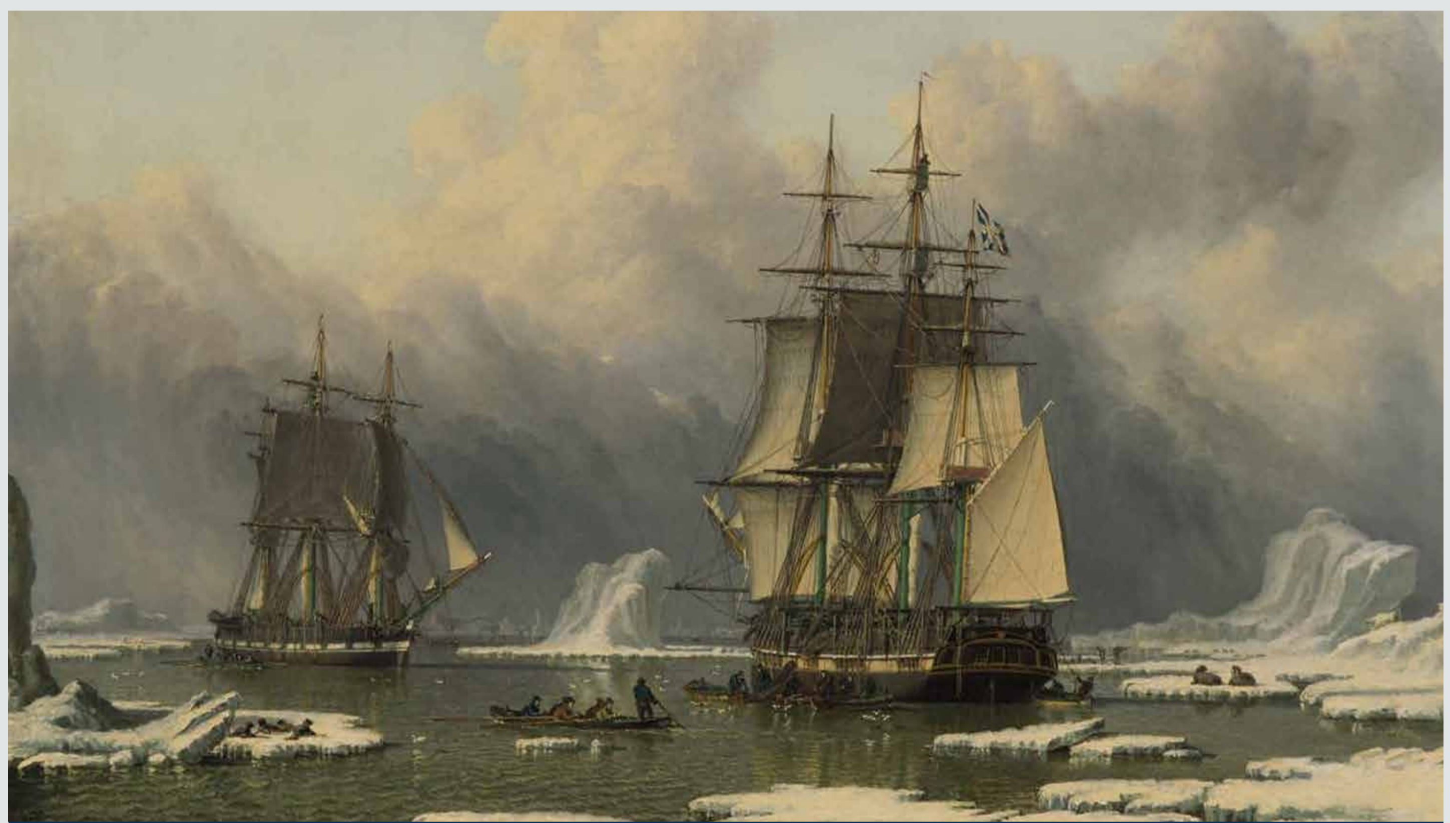
Łabędź i Izabela (The Swan and Isabella). Obraz namalowany przez Johna Warda, ok. 1830 r.

Przeciążona Stara Przystań („Old Haven”), czy port na rzece Hull były pod kontrolą bogatych kupców, którzy posiadali własne miejsca cumowania i nabrzeża załadownicze. Organy celne i akcyzowe nie były w stanie zbierać należnych podatków za wszystkie towary. Miły poczucie, że w Hull szerzy się przemysł i chciały wprowadzenia systemu, który dawałby większą kontrolę.