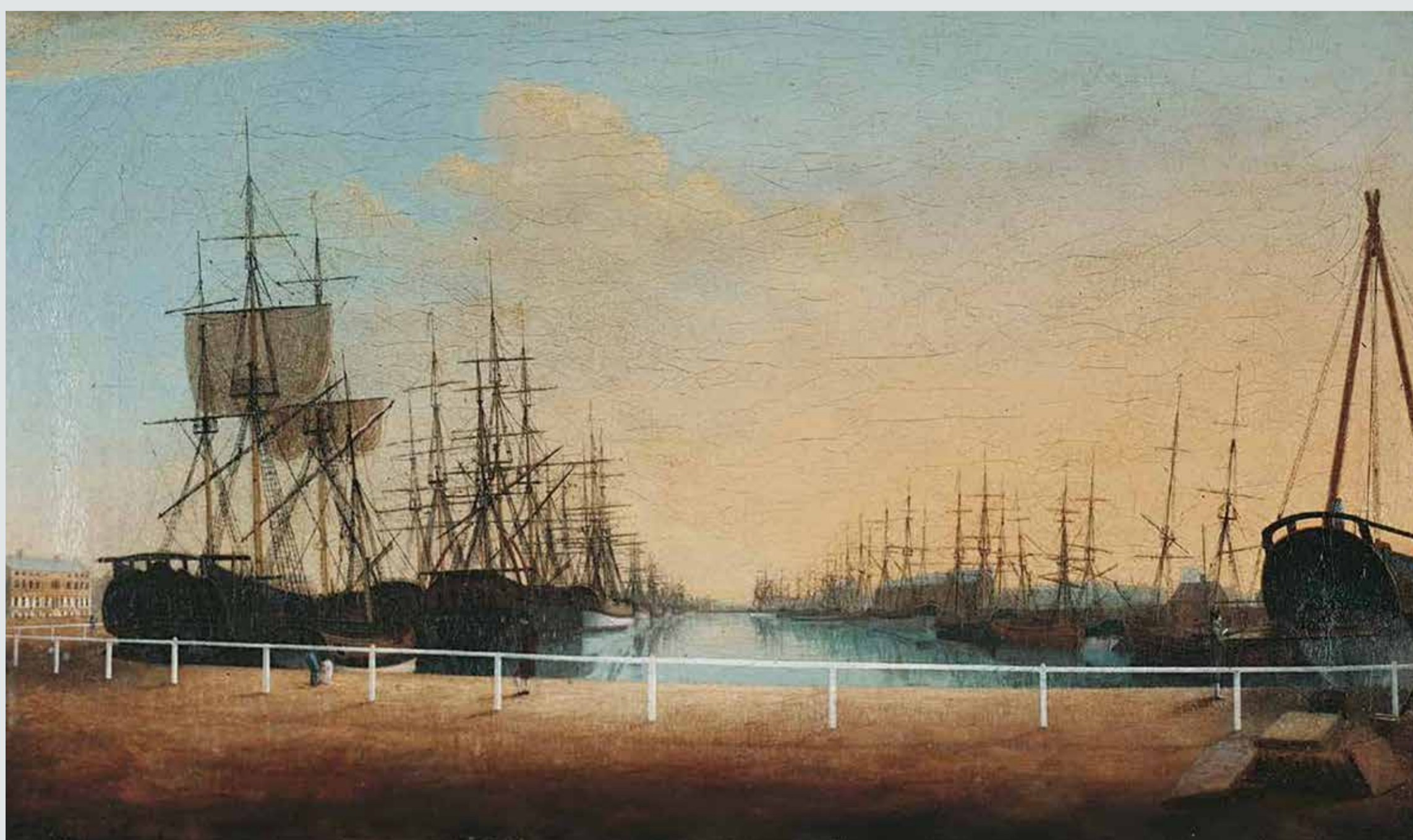
Картина («Вид на запад Нового дока в Кингстон-апон-Халле»), написанная Робертом Тью (Robert Thew) примерно в 1778—1786 годах. Из коллекции музея Ferens Art Gallery.

После завершения строительства этот док называли просто The Dock («Док»). Однако вскоре, когда Халлу понадобилось больше доков, его стали называть The Old Dock («Старый док»).