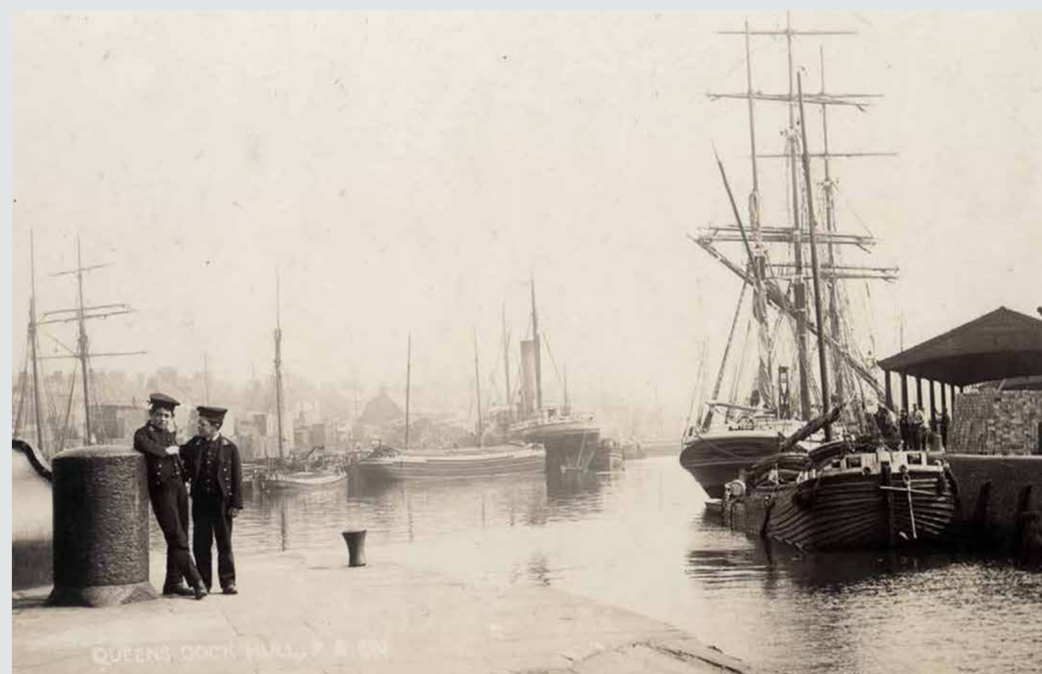
Доки Queens Dock, 1904. На иллюстрации изображен док Queens Dock, который в начале XX века все еще был оживленным местом. На месте, где вы сейчас находитесь, можно было увидеть навесы и погрузочные площадки, расположенные вдоль южной стороны дока.

Док был выкопан вручную рабочими. Для строительства использовались как местные материалы, такие как песок и гравий из Хессла и Олдбро, так и привезенные издалека. Камень доставляли из района Лидса, а специальный пуццолановый цемент, обеспечивающий прочность под водой, привозили из Италии. Длина дока составляла 519 метров (1 703 фута), а ширина — 77 метров (254 фута).